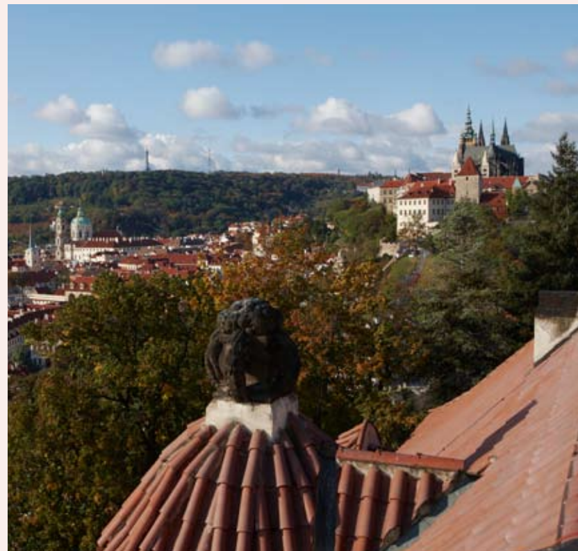
Pohled ze střechy vily na Pražský hrad

Vila Naděždy a Karla Kramářových slouží jako reprezentační prostor předsedy vlády České republiky a náleží mezi budovy, jež Úřad vlády České republiky využívá k plnění úkolů spojených s činností vlády. Mezi tyto objekty patří Strakova akademie, Hrzánský palác, Lichtenštejnský palác a vila Hany a Edvarda Benešových v Sezimově Ústí