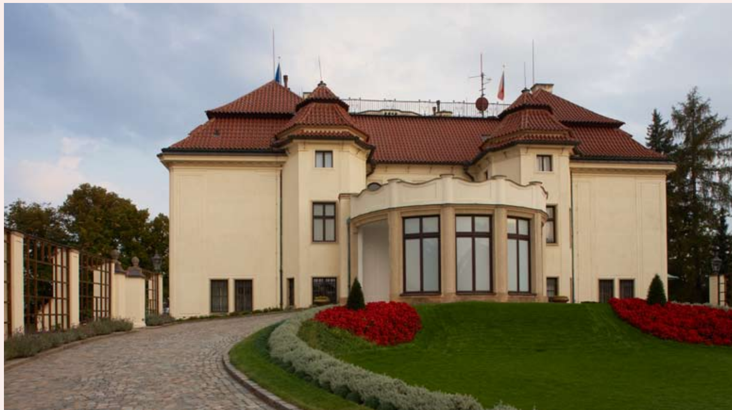
Severní průčelí s hlavním vstupem