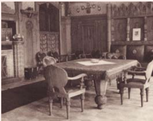
Kulečnickový sál, 30. léta