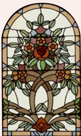
Vitráž ve vstupní hale