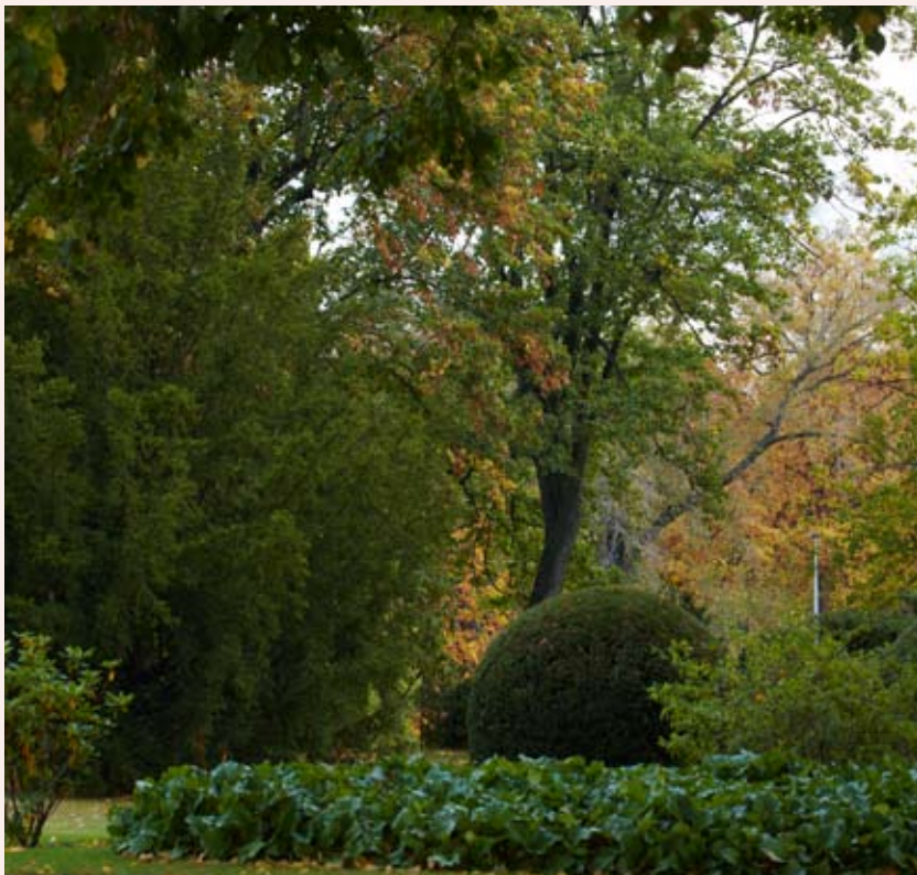
Pohled z terasy vily do zahrady

20. století vyplývá, že Thomayer na severovýchodní straně zachoval skupinu listnatých stromů, které na tomto místě musely růst již před výstavbou vily. Základem komunikační sítě se staly poměrně široké mlatové cesty, těsně sledující průběh zdiva bašty, které byly doplněny středovou, mírně obloukovitou cestou, z níž vybíhaly užší funkční pěšiny – k tenisovému kurtu, ke skleníku apod. Obvodovou cestu při hradbách lemovaly bloky stříhaného habrového plotu a vyšší dřeviny. Tato koncepce se v různém stadiu dochovala dodnes. Stromovými prvky tady byly především javory kleny ( Acer pseudoplatanus ). Promenádní charakter cest podtrhovaly však i další stromy, vysazené Thomayerem, tyto výsadby však již v současnosti nejsou příliš čitelné, zřejmě pro rozmanité zásahy v druhé polovině 20. století.