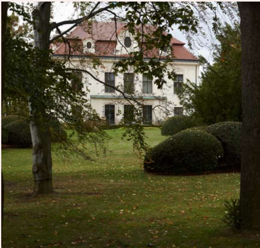
Východní průčelí vily