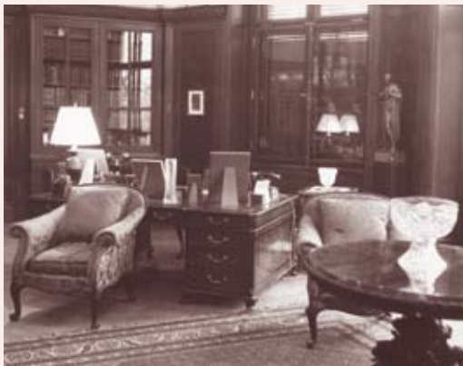
Psací stůl Karla Kramáře, 1938