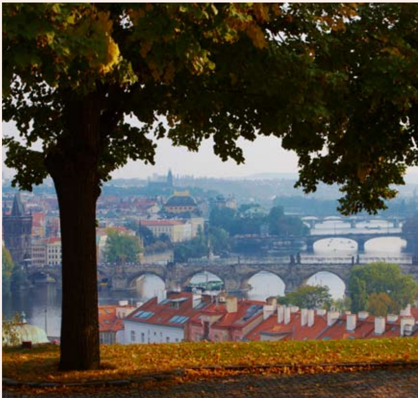
Výhled ze zahrady na pražské mosty