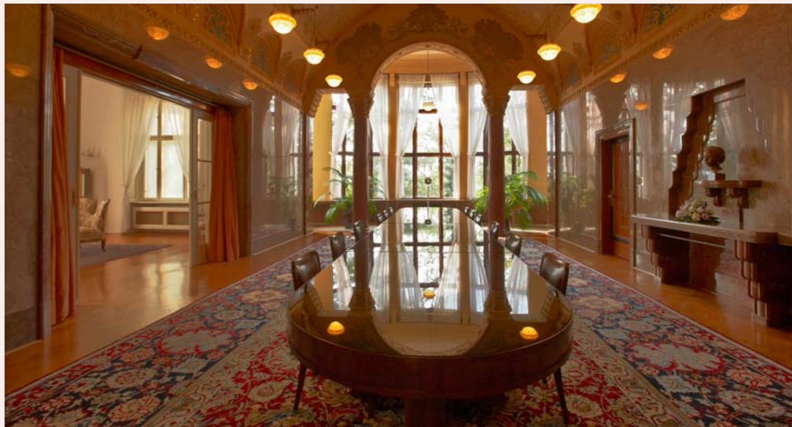
Jídelna se zimní zahradou