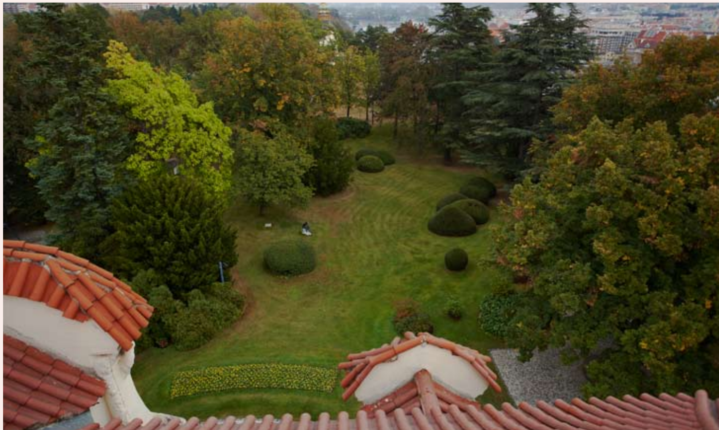
Zahrada před východním průčelím