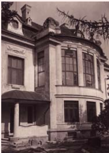
Okna zimní zahrady na západní fasádě, 1915