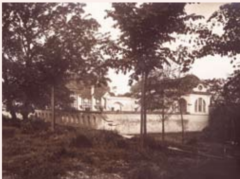
Skleník zbořený počátkem 50. let, 1915