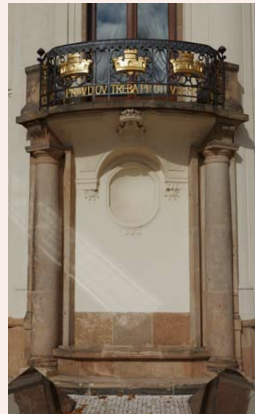
Ozdobné prvky jižní fasády