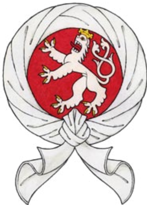
Řád točenice krále Václava IV., kresba Zdirad J. K. Čech. / Order of the Torse of King Wenceslas IV, illustration by Zdirad J. K. Čech.

Podle pravidel heraldiky se oficiální barvy odvozují od znaku tak, že prestižně první z nich odpovídá barvě erbovního znamení a druhá barvě štítu, přičemž se samozřejmě připouští nahrazování zlaté žlutou i stříbrné bílou. V českém případě šlo od roku 1253 o bílou a červenou. V 15. století se prosadily na bíločervených šňůrách připevňujících pečeti k listinám, vydaným z moci českého krále. Pokud ovšem český panovník nosil hierarchicky vyšší titul římského císaře, dostávaly přednost říšské barvy černá a žlutá. Například pro šňůry listin uherských králů se užívaly zelená s červenou, zelená vycházela z barvy trojvrší v uherském znaku s patriarším křížem. Na přelomu 14. a 15. století se ve střední Evropě objevily panovnické záslužné řády se skrytým náboženským významem. Nej-