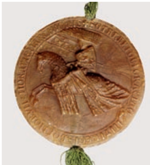
Revers posledního typu pečeti krále Přemysla Otakara II. z roku 1277. / Reverse of the last type of seal used by King Přemysl Otakar II from 1277.

Vládní nařízení z 19. května 1919 ustanovilo první znak Československé republiky, shodný s malým znakem starého českého státu a stylizovaný Jaroslavem Kursou. Zavedením tradičního dvouocasého lva mělo skončit období revolučních improvizací, charakteristické užíváním českého lva bez koruny na hlavě,