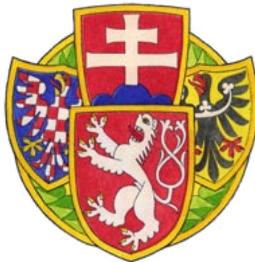
Legionářský znak, kresba Zdirad J. K. Čech. / Legionnaires' badge, illustration by Zdirad J. K. Čech.

Schválený velký státní znak přinesla druhá z možností. Navázal na vývoj české symboliky z doby před rokem 1752 a vyznačoval se monumentální působivostí. Autorem jeho výtvarné podoby byl stejně jako u ostatních znaků uzákoněných 30. března 1920 František Kysela. Oproti střednímu zahrnul velký znak