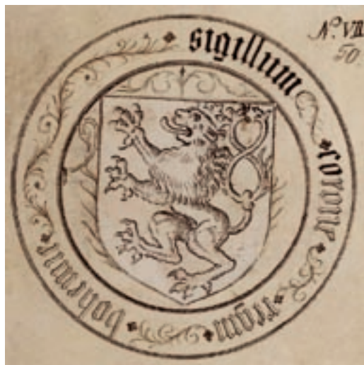
Česká státní pečeť z roku 1432. Kresba G. Dobnera z 2. poloviny 18. století. / Czech state seal from 1432. Illustration by G. Dobner, latter half of the 18th century.

Whereas older monarchs used the same seals - usually bearing depictions of themselves - for all state units, as of the formation of the Chancery of the King of Bohemia in 1453 specific royal seals with a Bohemian variant of the monarch's arms existed for this authority. They were attached to documents valid in the territory of the Crown; the small seal differed from the great seal in that it did not contain the side shields representing incorporated lands. After 1490, King Vladislav Jagellon held court in Hungary, and the resulting disputes on competence in respect of the execution of governmental powers resulted in the adoption of new state seals by