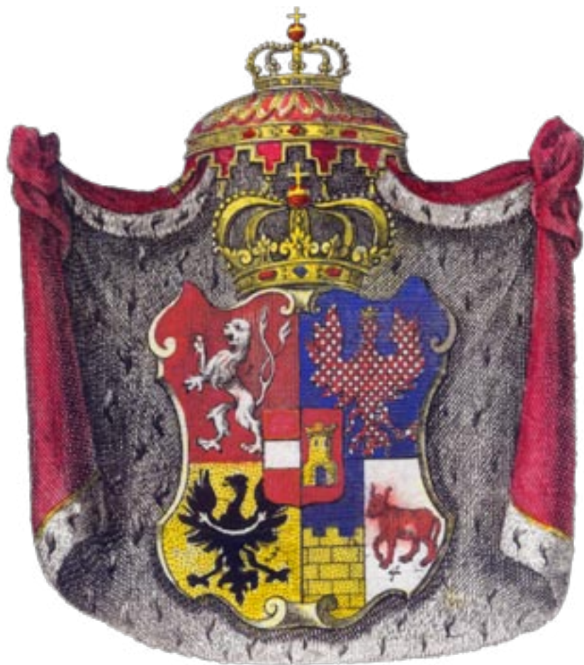
Neoficiální český znak císaře Karla VI. Norimberský erbovník z roku 1726, kolorováno. / Unofficial heraldic emblem of Emperor Charles VI representing the Crown of Bohemia. Nuremberg armorial from 1726, coloured.

orlicí. V roce 1462 císař Bedřich III. jako odměnu za pomoc obdrženu během vzájemných bojů mezi Habsburky polepšil moravský znak změnou stříbrné barvy šachování na zlatou. Český král však úpravu nepotvrdil a v praxi se neprosadila, až v 19. století ji začali vyzdvihovat odpůrci vazeb mezi Moravou a Čechami. Šlo především o moravské Němce, kteří si ze zlato-červeného šachování odvodili svoji podobu dvoubarevné moravské vlajky s horním žlutým a dolním červeným pruhem. Rakousko-Uhersko akceptovalo zlato-červené šachování moravské orlice