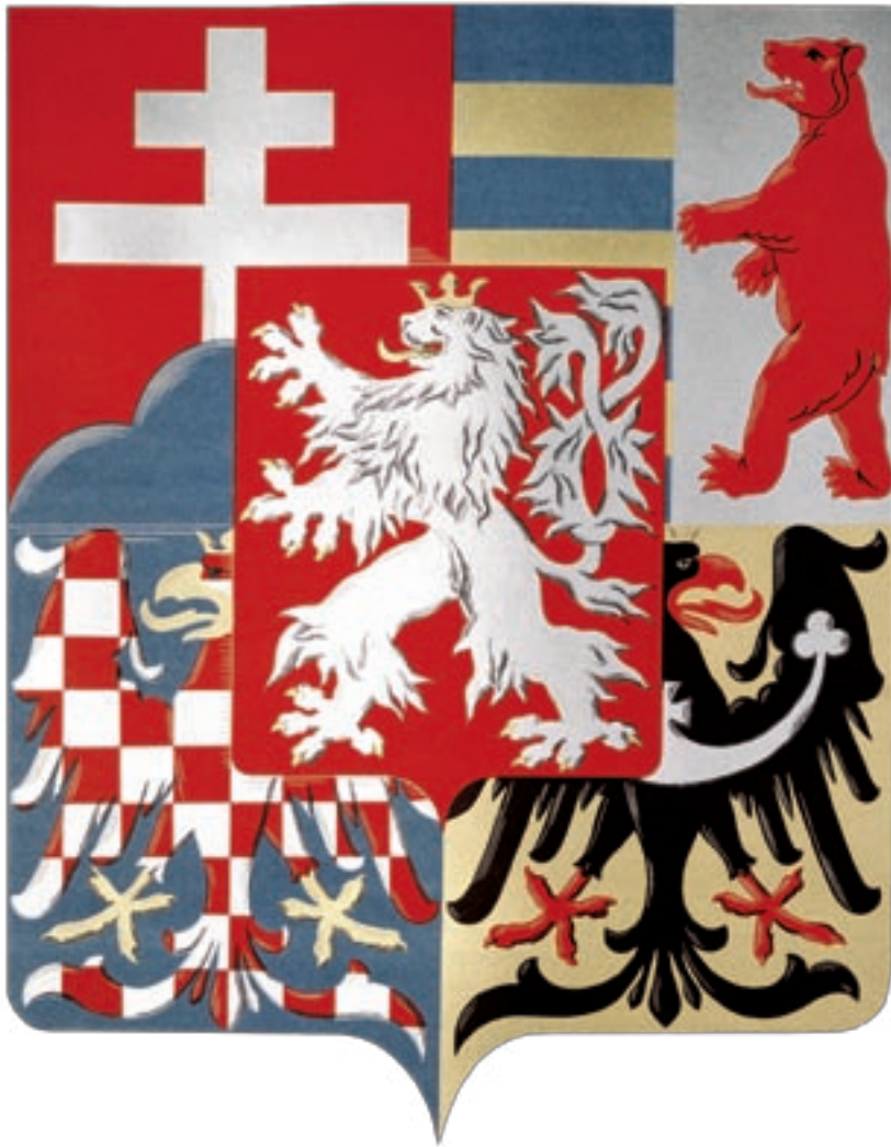
Střední znak Československé republiky z roku 1920. / Medium coat of arms of the Czechoslovak Republic from 1920.

navíc v dolní části zadního štítu trojici znamení, která měla vyjadřovat československé pozice ohledně oblasti Horního Slezska, kde existovaly hraniční spory se sousedními státy. Šlo o zlatou orlici v modrém poli, původní erb hornoslezských Piastovců, pro někdejší Těšínské vévodství, rozdělené mezi Československo a Polsko, o červeno-stříbrné polcené pole legitimizované poslední větve Přemyslovců pro Opavsko, jehož severní