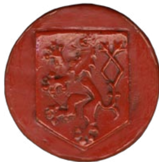
Provizorní státní pečeť Československé republiky, užívaná do roku 1924. / Provisional state seal of the Czechoslovak Republic, used until 1924.

The first Czechoslovak state seal was evidently only provisional. It depicted a shield with a two-tailed lion; because the official name of the state could not be anticipated, it bore no legend. Although the Act of 30 March 1920 enshrined the seal of the republic, it was not used until 1924. It took this long to come up with artistically high-quality ebony handles for the new seal matrices, designed by Damián Pešan. Under the Act of 1920, the