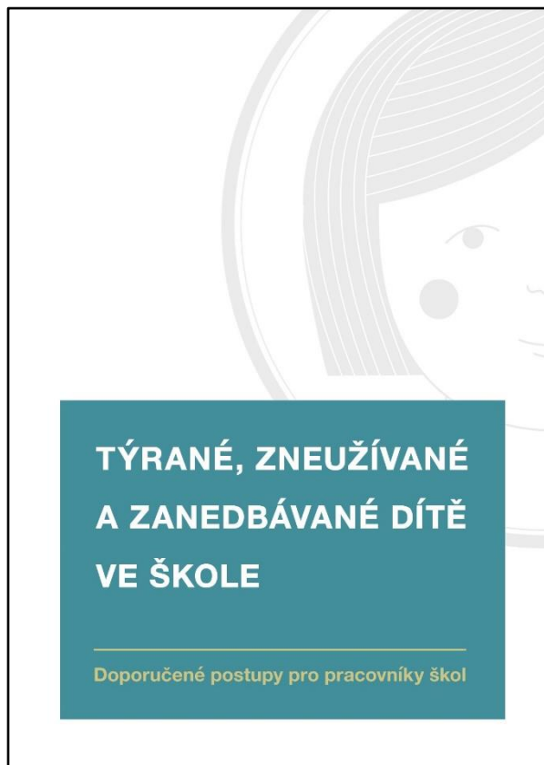
příručka Týrané, zneužívané a zanedbávané dítě ve škole 83 stran